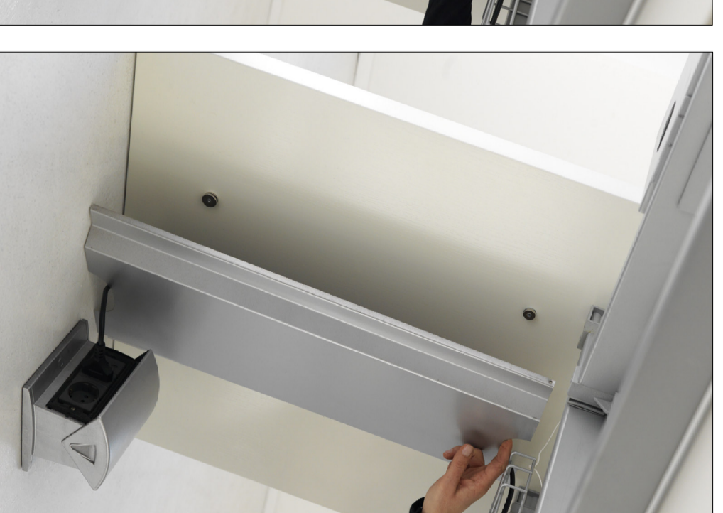
SISTEMA DI CABLAGGIO DEL PONTE