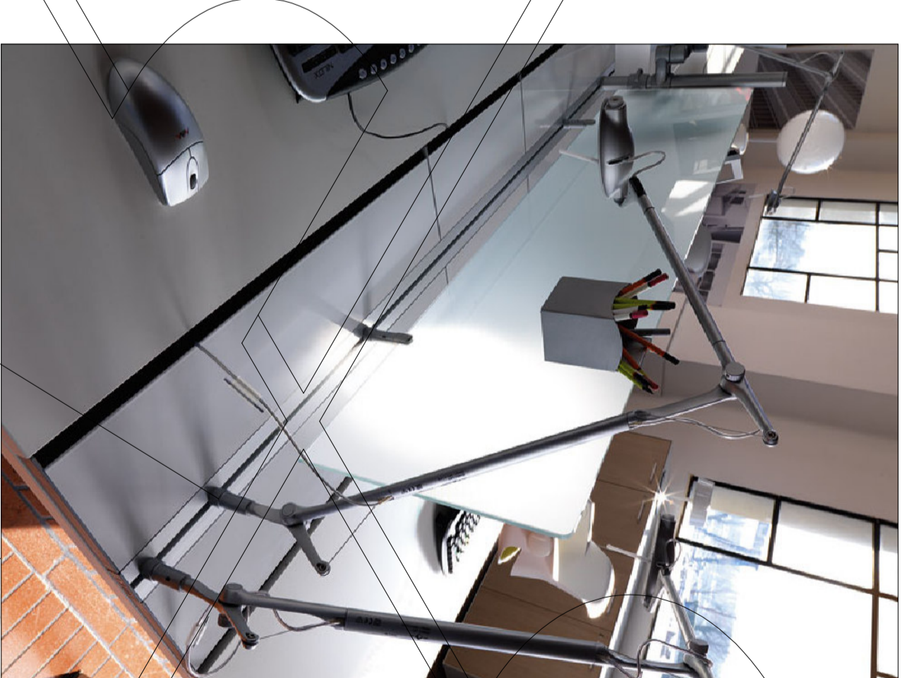
PARTICOLARE DELL'ATTREZZABILITÀ DEL BINARIO SUPERIORE CON LAMPADINE

PIANI DI LAVORO E TOP SUPERIORE DEL PONTE REALIZZATI CON TRUCIOLARE SPESSORE 18 mm + LAMINATO 9/10 AD ALTA RESISTENZA COLORE BIANCO O GRIGIO E BORDO IN ABS 20/10