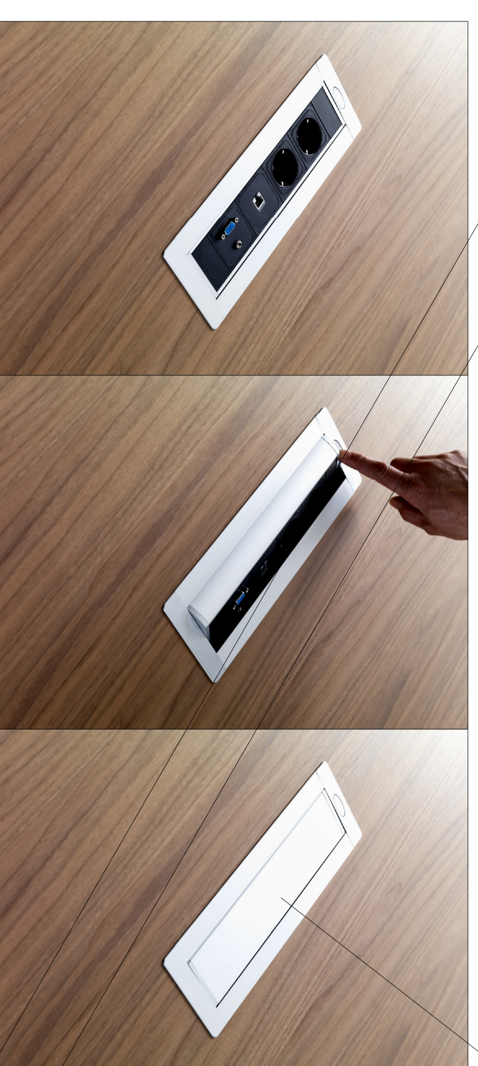
PARTICOLARE DEL SISTEMA DI CABLAGGIO PER OGNI POSTAZIONE DI LAVORO